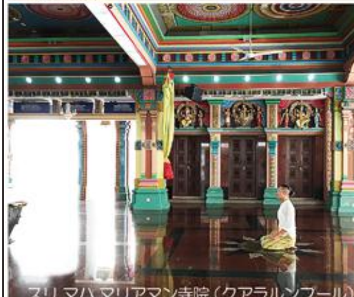
スリ マハリアマン寺院 (クアラルンプール)

自分自身の内と外、過去と未来、 そして、この世界をじっくり見つめる ための旅に出た。 土を耕し、肥やしをやるように、 脳ミソをマッサージし栄養を与える。 知らず知らずのうちに作り出す固定 観念を破壊して新しい創造に備える。 今回は、ヨーロッパからアジアへ海路 で巡った。ベニスを出航し、クロアチ ア、ギリシャからスエズ運河を通り、 アラブのヨルダン、中東のオマーン、 そしてインド、スリランカ、マレーシア、 シンガポールまで。 文明も、民族や宗教、また文化や 芸術も異なる国々で、人々と触れ合い その場の空気を肌で感じる時間にしたい という思いを携えて出航した。 船内では呆れるほど本を読み、 寄港地ではひたすら歩き回った。 ますます速くなる変化、世界情勢の中 での日本、そして表現者としての自分の 役割を、何にも邪魔されず、じっくりと 見つめ直す時間を持つことができた。 この星に脈々と続く人間の営みの中 にある文化、表現を自分の心で受けとめた。 地球規模でアップデートして 次の創作に向かいます。