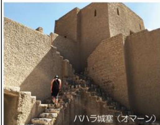
ハハラ城塞 (オマーン)